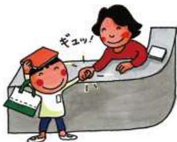
イラスト©全国学校図書館協議会

平成25年市内全小学校に、翌年には市内全中学校に学校図書館指導補助員が配置され8年が経ちました。1日4時間という限られた時間ではありますが、指導補助員が常駐化したことによって、授業時間だけでなく休み時間にも、多くの子どもたちが図書室を訪れ本を借りることができるようになりました。