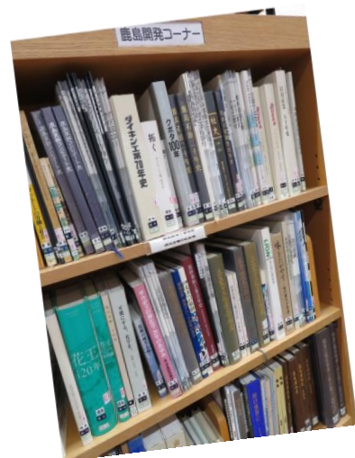
鹿島開発関連資料は専用コーナーがあります

図書館には、地元・神栖市についてのさまざまな資料がそろっており、現在も日々収集に努めています。そんな地域資料を使って例えばどんなことが調べられるのか、今回は「鹿島開発」「ピーマン」「波崎」「昔の写真」を取り上げてご紹介します。