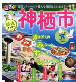
るるぶ特別編集の神栖市ガイド(K029 ル)

図書館には、地元・神栖市についてのさまざまな資料がそろっており、現在も日々収集に努めています。そんな地域資料を使って例えばどんなことが調べられるのか、今回は「鹿島開発」「ピーマン」「波崎」「昔の写真」を取り上げてご紹介します。