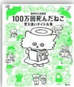
100万回死んだねこ (福井県立図書館/ 講談社/015ヒ)