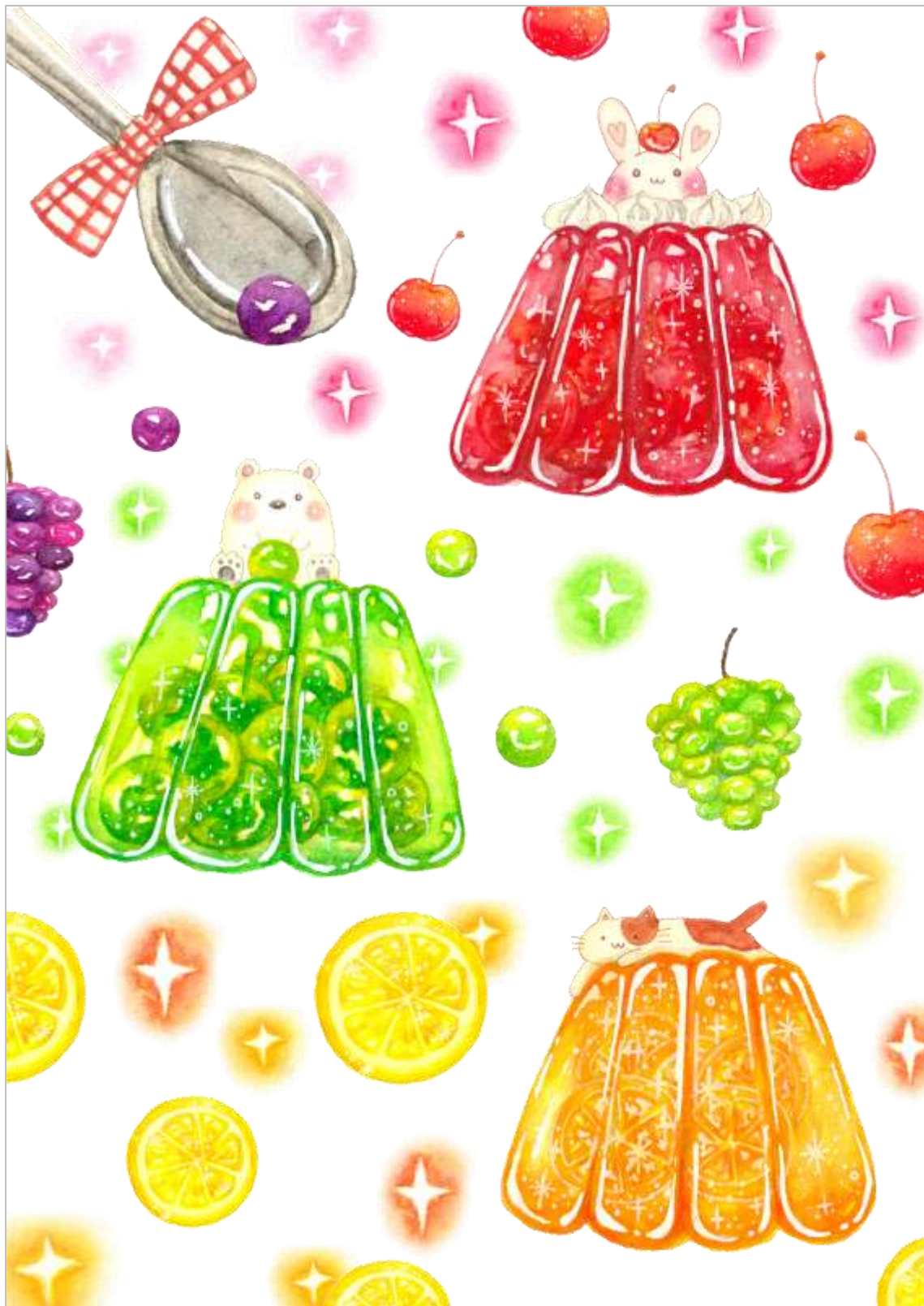
イラスト:まにゃさん(描きおろし)

キラキラ★ゆめかわいいゼリーと動物の水彩画です。ぜひ図書館 HP カラー版で見よう!ファンシーで超かわいいぞ!!