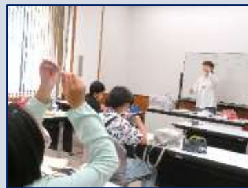
薄くはがした雲母を観察します。(下の写真)