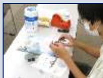
蛍石八面体作成の様子(上下写真)

中高生向けのワークショップを開催しました。当日は、雲母の観察(偏光板を使用して覗くと不思議な色が見えた)や鉱物を分別したり、蛍石の八面体を作成しました(ブラックライト照射で光る個体もあって面白い)。さとう先生の説明だけでなく、モバイル顕微鏡から微生物の観察もおこなうなど、もりだくさんの内容となりました。