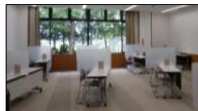
全部で18席あります。予約はできません。

以上の手順で静かに静かに自習できます! 水分補給はOKです。食事はできないよ〜。寝ないで〜。