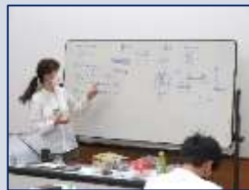
色の見えるしくみや鉱物に関する説明をするさとう先生