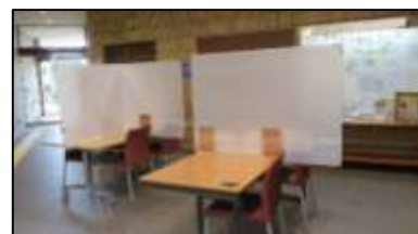
こちらのテーブルは申込なしで利用できます。