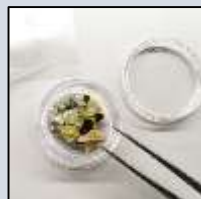
鉱物の分別はアンケート結果第1位の人気でした！