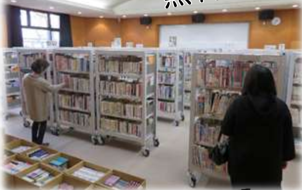
※2019年度の本のリサイクルの様子です