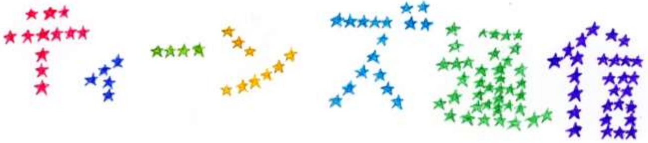
タイトルロゴ*神栖高校 O・Sさん 16歳*