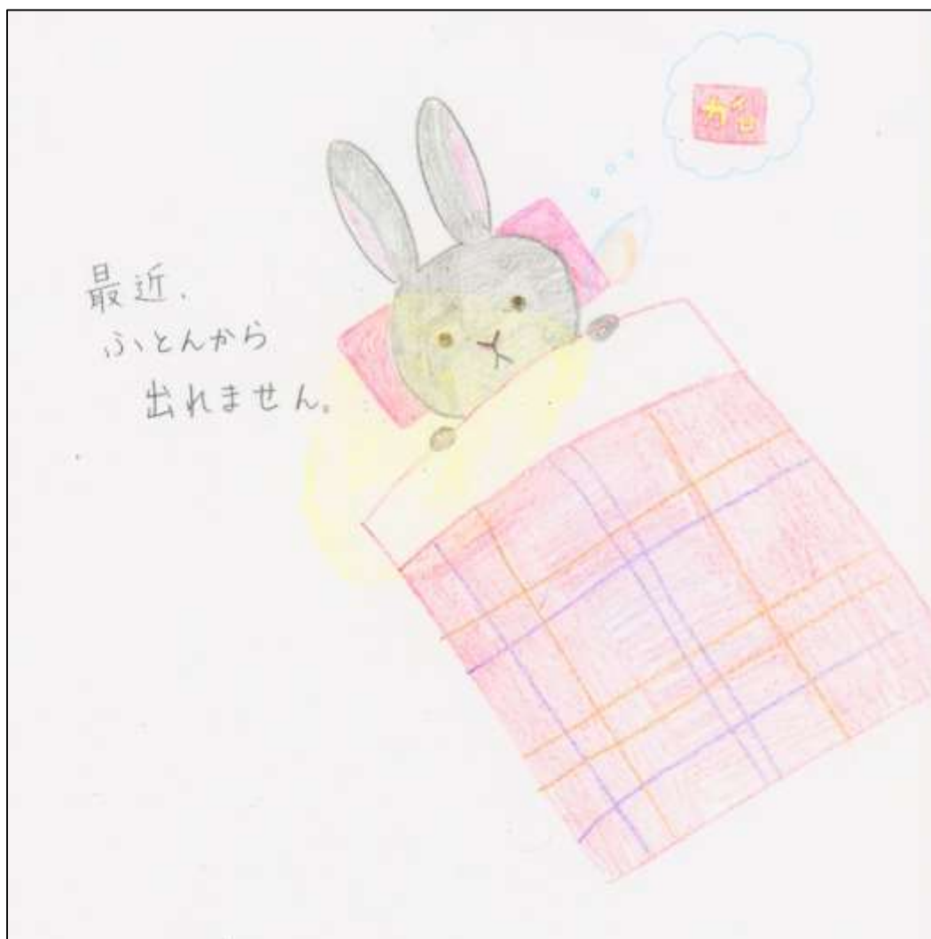
イラスト*うさぎさん 12歳*

#連載マンガ「そも図書」「神栖高校生、インターンシップ」の巻 #ティーンズにおすすめ☆新刊案内 コミック