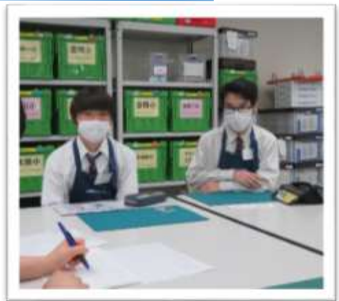
質問に真摯に答えてくれる2人。

O/I：やっぱり、今の中高生って動画をよくみていると思うので、動画で情報を発信していくのがいいと思います。本のあらすじを説明したり、対象者をしぼって、その人向けの動画つくったり。たとえば、受験生向けの本の紹介動画とか。 担当：なるほど動画配信はすぐに