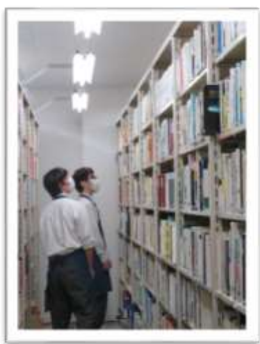
閉架書庫見学中の2人。