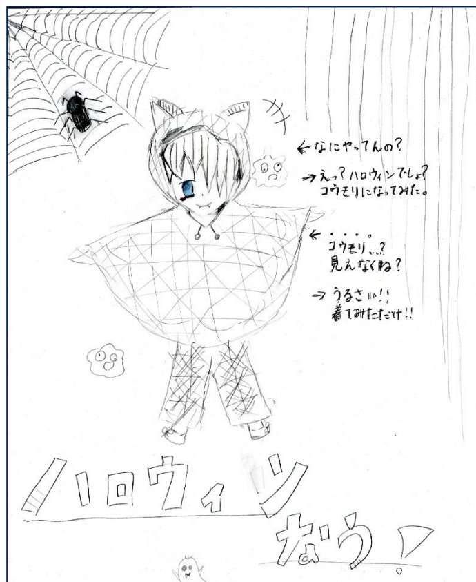
ちゃっかなさん 13歳

#連載マンガ そも図書 「To everything turn, turn, turn」の巻 #今月のコレ読も! 「フラッシュ・フィクション」 #図書館にきたらいばらきアナビエちゃん #ティーンズにおすすめ☆ 新刊案内 コミック