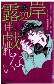
荒木飛呂彦 原作 北園ばらっと 著 集英社 (YF キシバ)