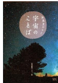
産業編集センター 著・出版 (Y440 ミ)

パンダは眠っている間も笹の消化に忙しい、イヌ科の王者オオカミは日なたでぐっすり、脳がないクラゲも実は眠っている。おもしろ可愛い生き物たちの奇妙な睡眠習慣を写真とともに紹介する。獐猛な生き物ほど寝顔が可愛いギャップ萌え♡