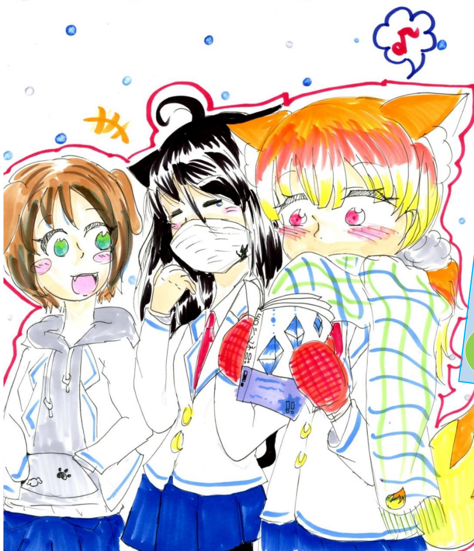
*マルチコピーパーパー★さん 13歳*