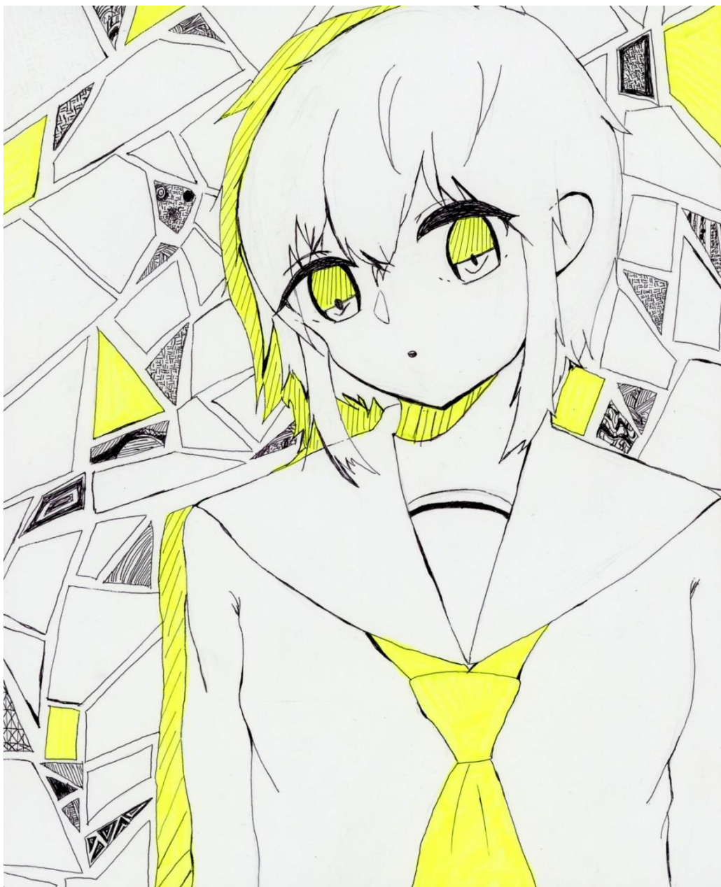
*ばんごはんさん 12歳*