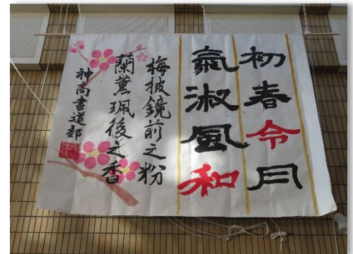
🌸 神栖高等学校『令和』

市内高校書道部のお正月を感じられる 慶春作品を展示しています。素敵な作 品なので見に来てね。待ってまーす。