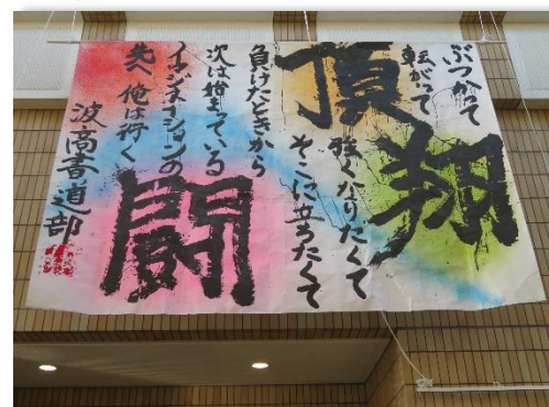
🌸 波崎高等学校『翔頂闘』